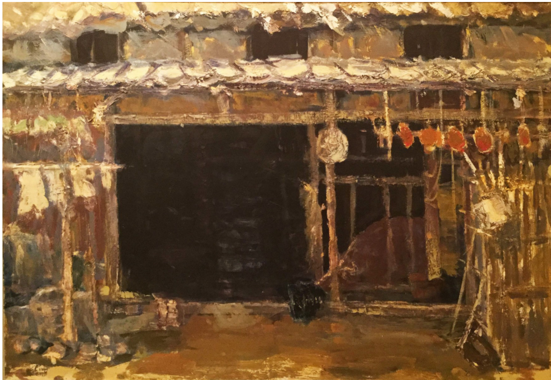
高山 始<牛のいる家>1978年(昭和53年) キャンバスに油彩/112.0×161.6cm

勝央町出身の洋画家 高山 始(たかやま・はじめ 1920-2013)の生誕100年にあたり、創作初期から晩年にいたる作品等を一堂に紹介する本展。日常の農村風景や営みを、油彩画においては日原晃の門下として、暗色を多用した重厚なタッチで丹念に描き、また、水彩画においては、身のまわりの植物などを描き、高山本来の持ち味を発揮した光あふれる透明感のある瑞々しい作品を是非お楽しみください。