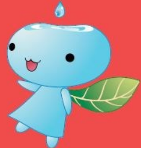
水の妖精 みずりん

本キャンペーンの割引きや特典等をぜひご活用いただき、鏡野町の自然をメインとしたアウトドア資源の旅をゆっくりとお楽しみください。健康のまち鏡野町でステキな滞在を♪