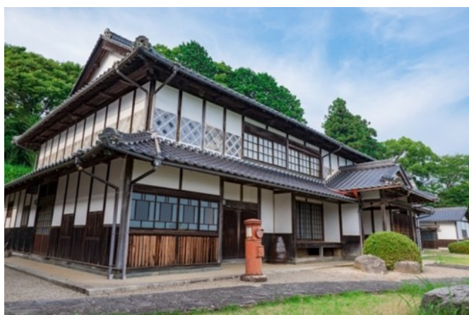
まるごと自由に使える空間