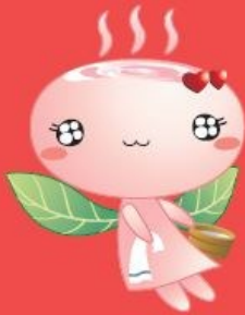
温泉の妖精 おゆりん

高清水トレイルや岩井滝、名勝奥津溪、岡山県立森林公園をはじめとした美しい自然スポットに恵まれた鏡野町では、新しい生活様式に対応した安心・安全な滞在を提供するため、宿泊施設をはじめ、飲食店や物産施設、温泉施設、美術館などに徹底した衛生対策をおこない、新型コロナウイルスの感染拡大防止に向けた一体的な取り組みを実施しています。