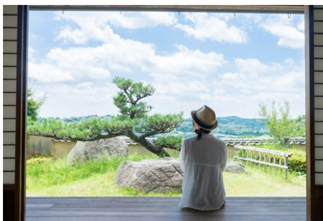
「なんにもしない」贅沢な時間