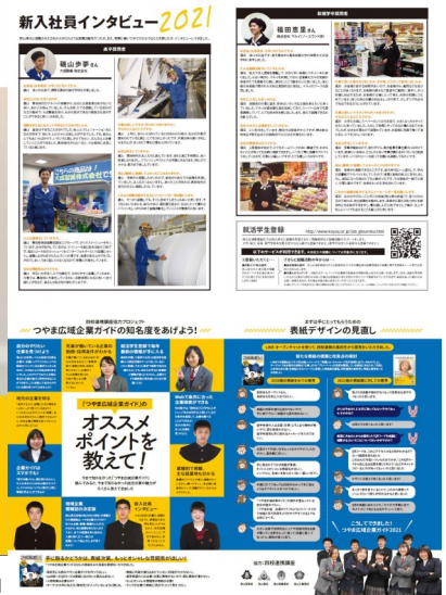
※画像は昨年度の「つやま広域企業ガイド2021」