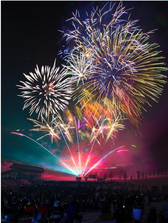
レーザー&花火ショー