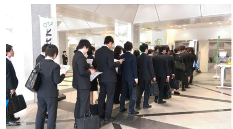
岡山コンベンションセンターの会場に入る参加者のみなさん

■問い合わせ先 津山広域事務組合 TEL0868-24-3633 FAX0868-22-9647