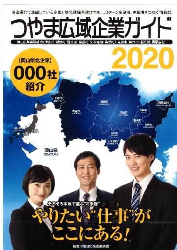
企業ガイドイメージ

※平成30年3月発行分から、名称を変更しています。(旧名称「企業ガイドみまさか」)