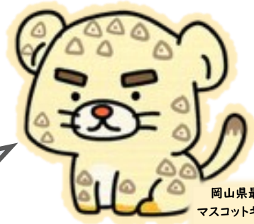
岡山県最低賃金 マスコットキャラクター 『サイチンじゃがぁー』