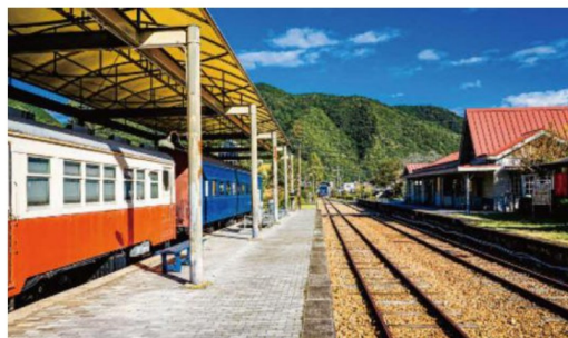
柵原ふれあい鉱山公園

また、昭和30年頃の鉱山の様子や鉱山町の暮らしぶりを再現した柵原鉱山資料館があり、ノスタルジックな気分を味わうことができます。